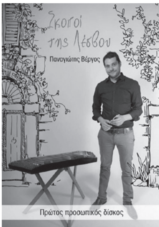
Πρώτος προσωπικός δίσκος

Ομοσπονδία Λεσβιακών Συλλόγων Αττικής (ΟΛΣΑ)