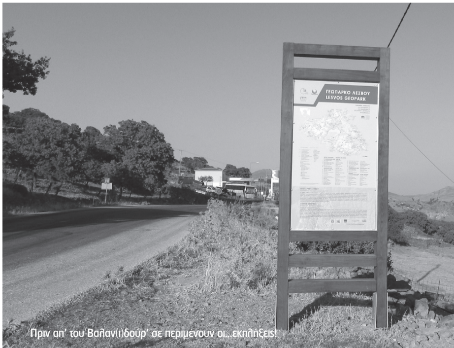
Πριν απ' του Βαλαν(ι)δούρ' σε περιμένουν οι... έκπληξεις!

Ό ταν έρχεσαι στο χωριό απ' την ανατολή αλλή κι όταν το αποχαιρετάς στρίβοντας «σου Βαλαν(ι)δούρ'» φέτος σε περίμενε μια διπλή ευχάριστη έκπληξη! Το βενζινάδικο του χωριού ήταν ανοιχτό, μετά από ένα-δύο χρόνια απραξίας, και στο πρόσωπο ενός καλοσυνάτου υπαλλήλου σε καλοδεχόταν για να βάλεις καύσιμο στο τροχοφόρο σου, να δώσει λύση σε παραπανίσιες έννοιες-σκάσιμο λάστικων, καθαριότητα κ.α. αλλή και να σε δροσίσει με ένα αναψυκτικό, καθώς ο δρόμος σου είναι μακρύς! Κι όλα αυτά έγιναν πράξη χάρις στην πρωτοβουλία και την τόλημ του αγροτικού συνεταιρισμού Μεσοτόπου, που είδε πως δεν μπο-