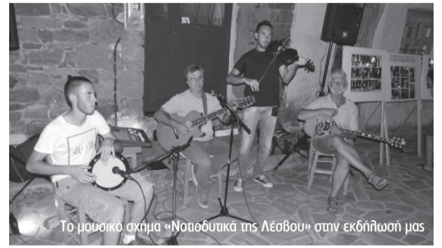
Το μουσικό σχήμα «Νοτιοδυτικά της Λέσβου» στην εκδήλωσή μας