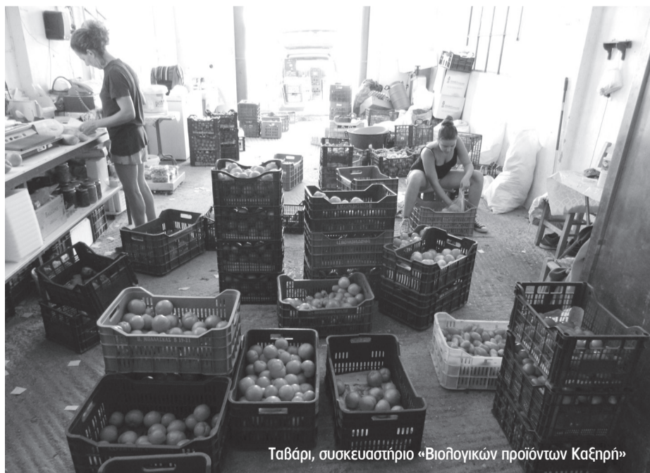
Ταβάρι, συσκευαστήριο «Βιολογικών προϊόντων Καζηρή»