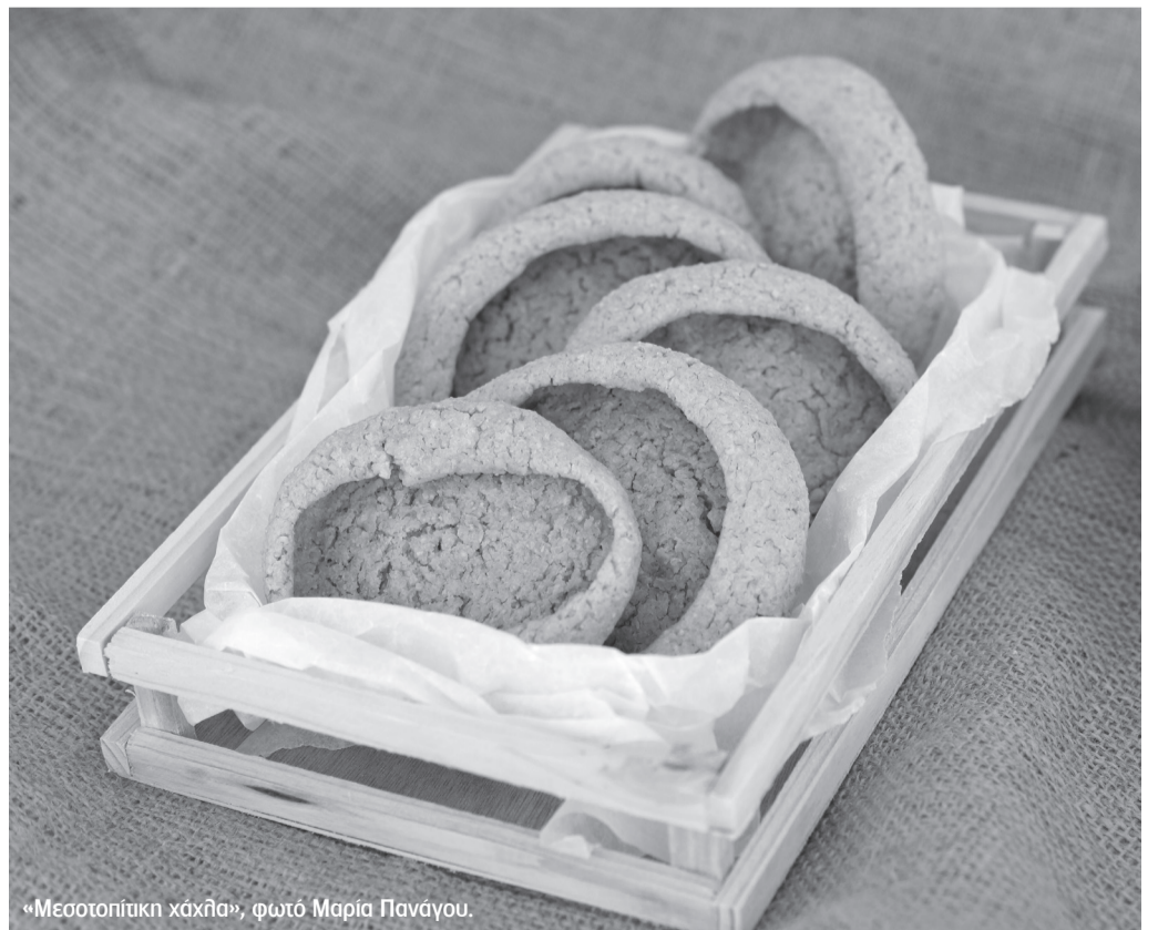
«Μεσοπολιτική χάχια».

Όλες οι προετοιμασίες πάνε μέλι-γάλα και σε λίγο διάστημα το πεντανόστιμο Ημερολόγιο 2017 θα βρίσκεται στα χέρια σας! Απολαύστε το με όρεξη! Το «μαγειρέψαμε» για σας με καλοδιαλεγμένα υλικά: μεράκι, αγάπη και φροντίδα! Εξάλλου, αν βρεις φαΐ κάτσε, αν βρεις ξύλο φύγε!