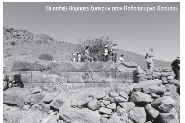
Οι παλιές θύμνες ξηνούν στον Παλιόπυργο Χρούσου