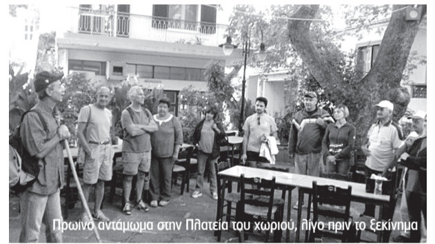
Πρωινό ανάμωμα στην Πλατεία του χωριού, λίγο πριν το ξεκίνημα