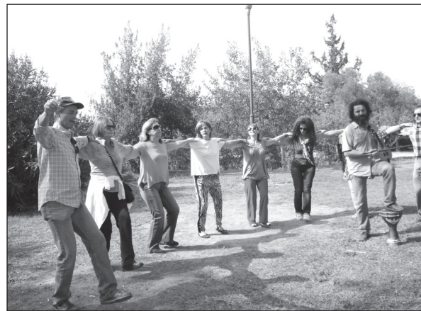
Χορεύετε, παπούτσια μη ληπάστε!