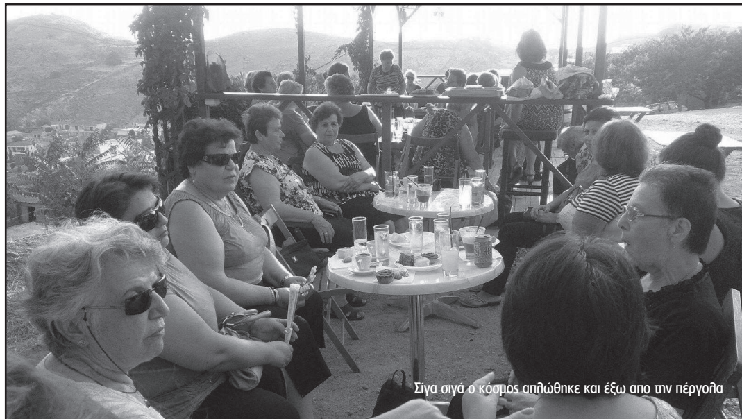
Σίγα σιγά ο κόσμος απλώθηκε και έξω από την πέργκολα