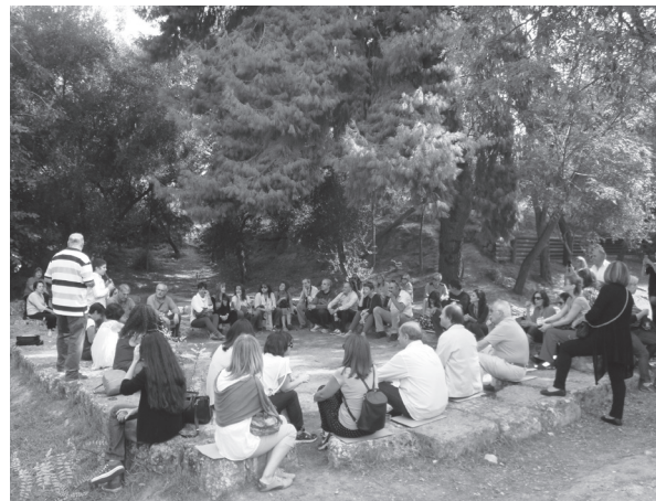
Στην Παλαιστρά της Ακαδ. Πλάτωνος