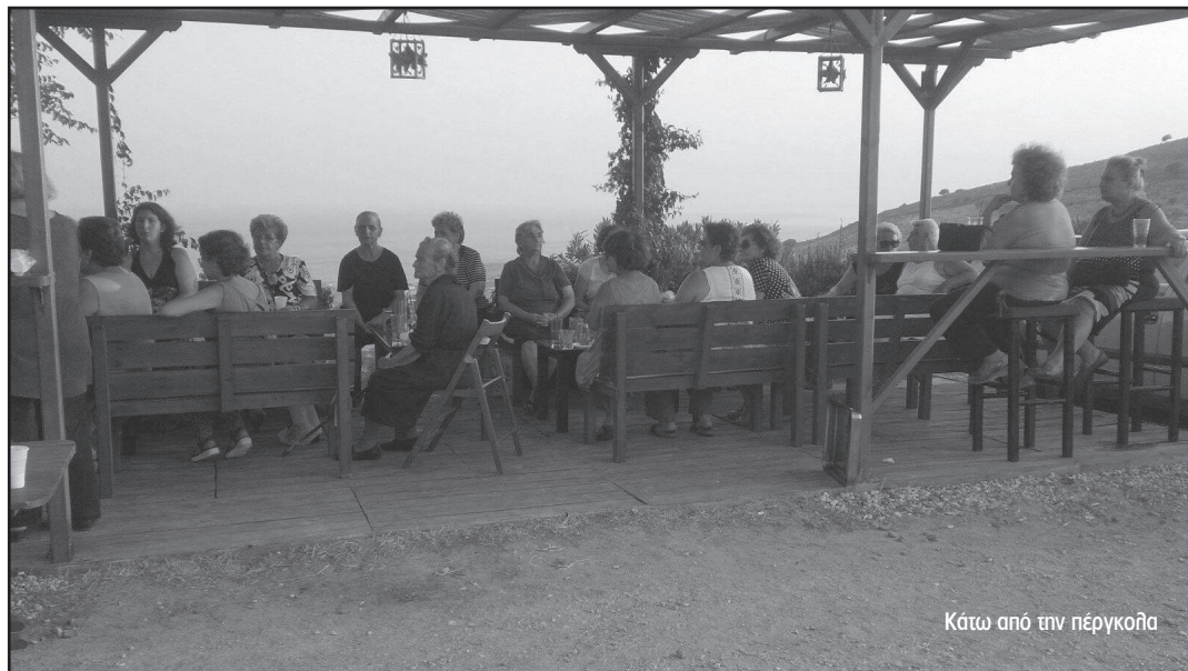
Κάτω από την πέργκολα