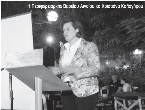
Η Περιφερειάρχης Βορείου Αιγαίου κα Χριστίνα Καλογήρου

Παρακάτω δημοσιεύουμε τον χαιρετισμό στην εκδήλωση του προέδρου του Σύλλογου μας, Φώτη Βασιλόγλου, καθώς και τις επιστολές που λάβαμε..