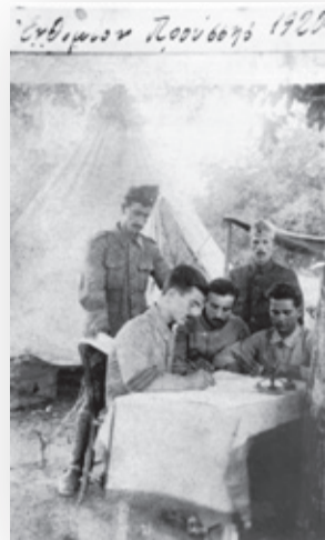
Ενθύμιον Προύσσης 5-8-20

Καμιά φουρά έρχιτι η Στρακίς... «Φουρτώνιτι» μένα!