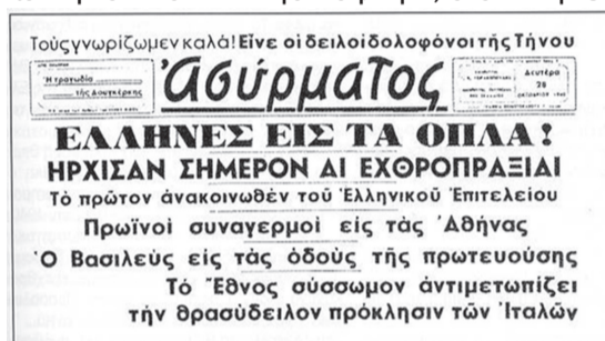
Η πρώτη σελίδα της εφημερίδας "Ασύρματος" της 28ης Οκτωβρίου.

τίας, από κει και πέρα άρχισαν τα μονοπάτια μέσα στο σκοτάδι. Όσοι ήξεραν τον δρόμο μπήκαν μπροστά, τελικά φθάσαμε στα Παράκοιλα, υπήρχαν μερικά καφενεία ανοιχτά, και μείναμε έως το πρωί. Όταν νύχτωσε, ήρθαν τα φορτηγά και μας πήρανε και φθάσαμε σε ένα χωριό Νάπι, κοντά στη Μυτιλήνη, μείναμε εκείνο το βράδυ μέσα σε μια απο-