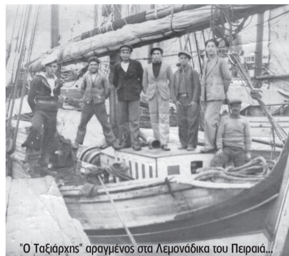
"Ο Ταξίαρχης" αραγμένος στα Λεμονάδικα του Πειραιά...

Ξεκίνησε το καϊκι για να ξεφορτώσει το αλεύρι στο Πλωμάρι, που ήταν και ο τελικός του προορισμός.