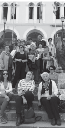
Από παλιότερη εκδρομή στην Παναγία την Τρυπητή (Αίγιο).

Ελπίζω με ό,τι περάσαμε να κοιτάξουμε λίγο πιο βαθιά μέσα μας, να βγάλουμε το σωστό εαυτό μας προς τα έξω και να αξιοποιήσουμε το μέλλον με τον καλύτερο δυνατό τρόπο. Εύχομαι να είμαστε υγιείς, δυνατοί και να ξαναανταμωθούμε με νέα ενέργεια, να συνεχίσουμε ό,τι έμεινε μισό και να έχουμε ΚΑΛΟ ΚΑΛΟΚΑΙΡΙ!