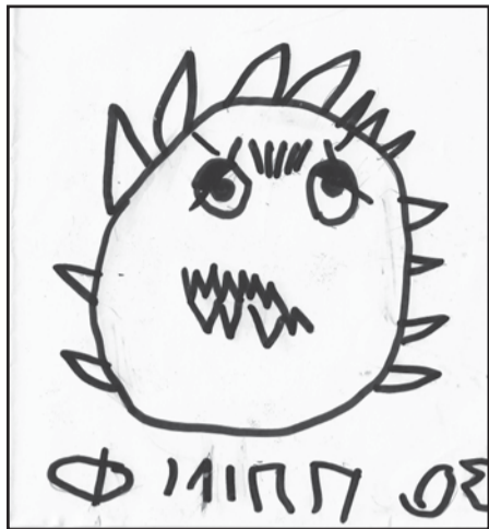
Ο κορωνοϊός! Φίλιππος Βάσιος, 4,5 ετών