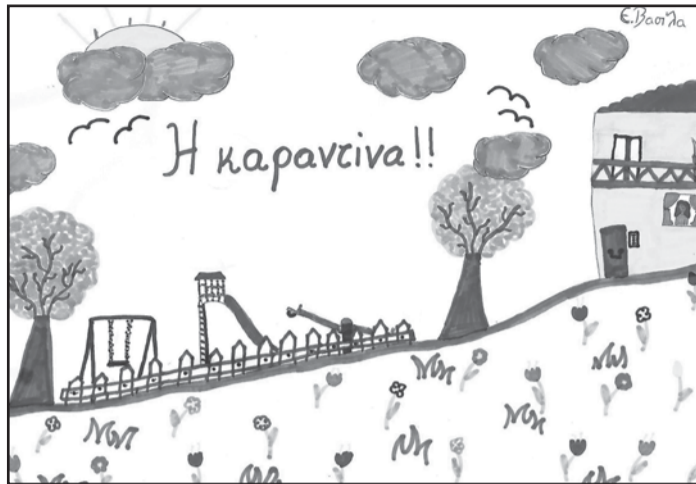
Ελπίδα Βασιίλα, 10 ετών