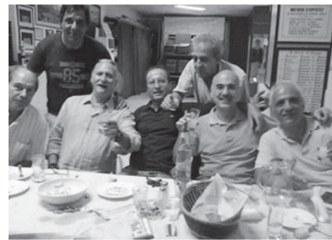
Το δευτεριάτικο τραπέζι!

Για μένα η καραντίνα δεν είχε καμιά ιδιαίτερη διαφορά διότι δούλευα κανονικά όλο το διάστημα. Έχασα βέβαια ορισμένα πράγματα, όπως τις Κυριακές που πηγαίναμε στο Σύλλογο για το χορευτικό και τις Δευτέρες που είχαμε το δευτεριάτικο τραπέζι, που μου έλειψαν πραγματικά. Το δευτεριάτικο τραπέζι είναι μια εκτόνωση για μένα. Ερχόμασταν, πίναμε το ουζάκι μας, με την παρέα μας, με τα τραγουδάκια μας, με τα καλαμπούρια μας, όλα αυτά έκαναν ένα ωραίο πακέτο και περνούσαμε όμορφα και καλά. Και ξαφνικά διακόπηκε, για το καλό όλων μας βέβαια, αλλή απότομα, μας έκοψε τα πόδια. Πάθαμε στερητικό σύνδρομο... Κανένας δεν το φανταζόταν ότι θα απομακρυνθούμε έτσι