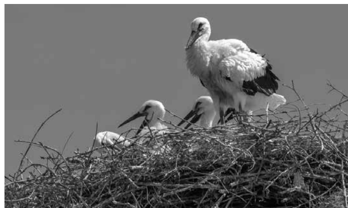
Νεοσσόι πελαργών στην Καλλονή, Ιούνιος 2020

Καλώς τα δεχτήκαμε το λοιπόν, ας ελπίζουμε ότι θα έχουμε σύντομα γεννητούρια και θα υποδεχόμαστε και τα επόμενα χρόνια αυτά τα υπέροχα πλάσματα στον Μεσότοπό μας!