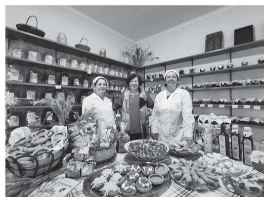
Οι γυναίκες του αγροτουριστικού μας συνεταιρισμού επί το έργον!

Ο γυναικείος συνεταιρισμός του Μεσοτόπου είναι ένα άλλο θέμα που αξίζει τον θαυμασμό μας! Οι γυναίκες του χωριού στεγάζονται στο δικό τους καταπληκτικό κατάστημα, διακοσμημένο με υπέροχο γούστο και φινέτσα. Μου αρέσει να πηγαίνω εκεί -στα Πλακειά- και να παρατηρώ τα διάφορα βάζα με μαρμελάδες και γλυκά κουταλιού που είναι καλά αποθηκευμένα στα ράφια: σύκο, βερίκοκο, κυδώνι, ντοματάκια, ακόμη και πατάτες! Υπάρχουν υπέροχα μπουκάλια λικέρ, βυσσινάδα, σιρόπι αμυγδαλιού-σουμάδα.