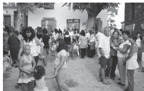
Στη γιορτή του Λαογραφικού Μουσείου (2009)

Στις αρχές Αυγούστου ξυπνούν νωρίς το πρωί για να φτιάξουν τον τραχανά, τις «χάχλες», όπως τις λέν' στη γλώσσα του χωριού, εξαιρετική σοδειά για τον χειμώνα! Τις πλάθουν με το χέρι και τις απλώνουν να στεγνώσουν στον ήλιο. Δουλεύουν σε παρέες, φίλες και γειτόνισσες συναντιούνται νωρίς το πρωί, συνομιλούν, γελούν, ανταλλάσσουν ειδήσεις και συνταγές, μοιράζονται μεγάλες εργασίες που απαιτούν πολύ χρόνο. Προετοιμάζουν με αγάπη και υπομονή τη ζύμη και ανταμώνουν