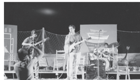
Συναυλία, Ταβάρι 4 Αυγούστου 1990