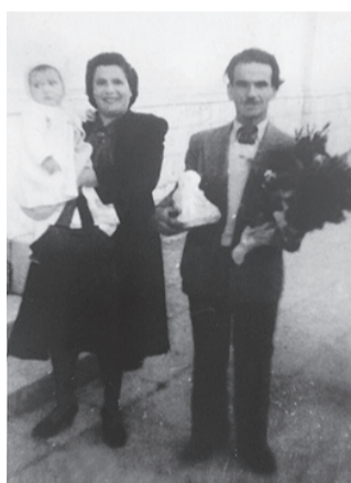
Οι γονείς μου και εγώ μωρό στην Αθήνα τέλη του 1947.

Το έτος 1945 κάνανε το ταξίδι του μέλιτος, όπως έλεγε η μαμά μου, με το καϊκι του Μούχαλου. Προορισμός η Αθήνα. Το καϊκι μετέφερε τρόφιμα, κότες, πρόβατα, κατσίκες κ.λπ. Μία από αυτές τις κατσίκες συνόδευε και τη μαμά μου. Άραξαν στο Πόρτο Ράφτη και με ένα φορτηγό, ανεβασμένοι οι γονείς μου πάνω στην καρότσα του και με όλο