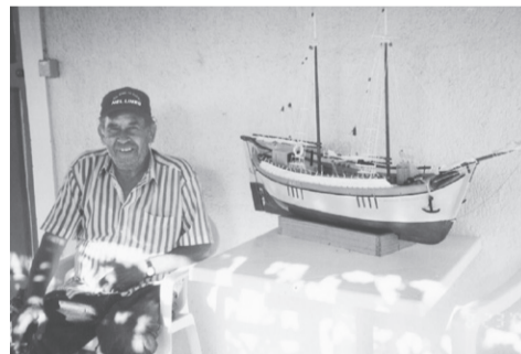
Στην Ποταμιά παρέα με το σκαρί.

Λέω στα 'γγόνια μ': Κάποτε, λέω, μπουρεί να γίνου και γω μ'κρός Θεόφιλους-άμα πουθάνου-τση να ψάχνι τα καϊτσια να τα βρούτι ... Τση γιλούμι!!!