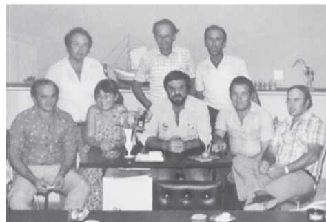
Στο 2ο Διοικητικό Συμβούλιο του Συλλόγου.