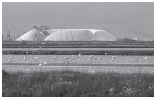
Η αλυκή της Καλληονής.

Δύο η ώρα φύγανε, η βάρκα με τα κουπιά και πανί, μηχανές δεν υπήρχαν τότε. Το απόγευμα φυσούσε βόρειος άνεμος και ήταν ευνοϊκός να έλθουν οι βάρκες με το πανί από τον Πολιχνίτο. Πράγματι κατά τις 6 η ώρα απόγευμα, φανήκανε που ερχότανε, το πανί τους όσο ζυγώνανε, φαινόταν και η βάρκα -ίσα βάρκα,