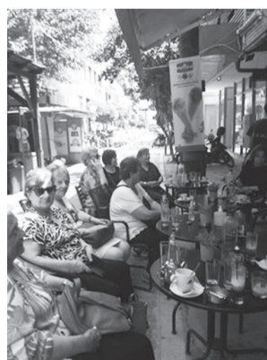
Τμήμα της συντροφιάς

Στο εξωτικό Male ("Μαλέ"), στις 29 Μαΐου, βρέθηκε η γυναικεία συντροφιά. Η κοσμοπολίτικη και ιστορική «Αίγλη» ήταν κλειστή (για επιχειρησιακούς λόγους) και έτσι το καφέ MALE στη Δάφνη φιλοξένησε την όμορφη παρέα μας.