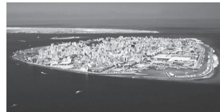
Το νησί Male όπως φαίνεται από το google maps μοιάζει με τα πλοία, που μας πάνε στο νησί μας.

Για το τμήμα γυναικών Χριστίνα Γιαννουκάκου-Κουρλή