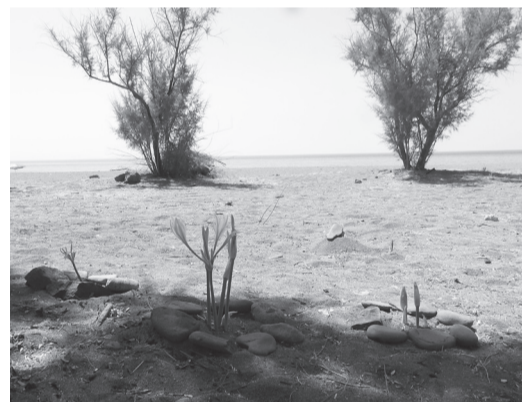
Ποδαράς, οι θαλασσοκρίνοι αντέχουν ακόμα!

Ξεχωριστός πλούτος διαχρονικά για τον Μεσότοπο είναι οι κάθε είδους καλοκαιρινές εκδηλώσεις με επίκεντρο τον πολιτισμό. Και φέτος, ύστερα από δύο χρόνια δύσκολα, έγιναν με επιτυχία πλήθος συλλογικών δράσεων. Και τις χαρακτήρισε γι' άλλη μια φορά η ενότητα και η συνεργασία όλων των φορέων-Συλλόγων στον σχεδιασμό και στην υλοποίηση. Κουβαλάμε προίκα εμείς οι Μεσοτοπιίτες, κουλτούρα συνεργείας, τη συλλογικότητα, την αλληλεγγύη, τον εθελοντισμό και την προσφορά στο «κοινό καλό» σε όλη την ιστορική μας διαδρομή. Κι η μαγιά βαστάει ακόμα! Και δίνουν, αυτές οι τοπικές εκδηλώσεις, ευκαιρίες σε πολλούς -άνδρες, γυναίκες και παιδιά, όχι μόνο να τις παρακολουθήσουν ως θεατές και να ευφρανθεί η ψυχή τους, αλλά να πάρουν μέρος, να συμμετέχουν, να δράσουν, να χαρούν, να γνωρίσουν ακόμη πιο πολύ τον τόπο που επιλέγουν για διακοπές!