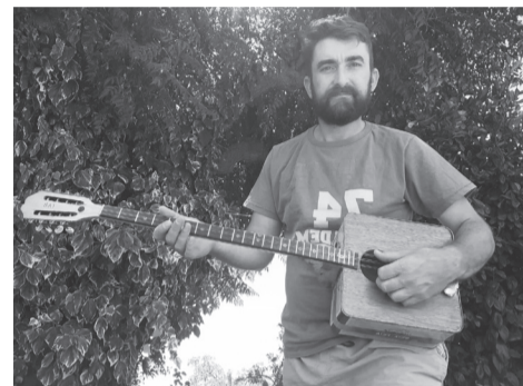
Μπουζούκι από τενεκέ φέτας!

κο τσουμπούς και το αμερικάνικο μπάντζο. Στα υπόλοιπα μέρη, χορδές, τάστα κ.λπ. χρησιμοποιώ τα κανονικά. Η θεώρηση σε όλα τα όργανα που κάνω βασίζεται στο