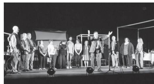
Η θεατρική ομάδα επί σκηνής!