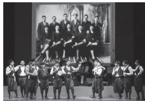
Της πορτοκαλιάς τα φύλλα, Μεσοτοπιίτες και Κύπριοι γλέντιστάδες...

Την Δευτέρα, λίγο πριν την επιστροφή ξεναγηθήκαμε στο παραδοσιακό χωριό Λεύκαρα, με την ιδιαίτερη τοπική αρχιτεκτονική και την παράδοση της λαϊκής τέχνης των κεντητών.