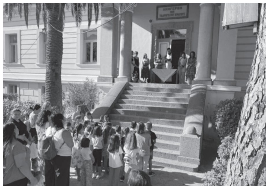
Ο φετινός αγιασμός στο Δημοτικό μας σχολείο

Τέλος, καλό είναι οι γονείς να ενθαρρύνουν τα παιδιά να διαβάζουν μόνα τους. Μπορούν να τους δείξουν τρόπους διαβάσματος, που ενδέχεται να τους βοηθήσουν, αλλά πρέπει να αφήσουν την αυτονομία και την υπευθυνότητά τους να ενισχυθεί. Μπορούν να παρέχουν συμβουλές και προτροπές αλλά ο ρόλος τους στο διάβασμα καλό είναι να έχει βοηθητικό χαρακτήρα ως προς την οργάνωση του χρόνου ή ως προς το να βάζουν προτεραιότητες στις υποχρεώσεις τους. Τέλος, μην ξεχνάτε να τονίζετε στα παιδιά σας ότι στο σχολείο δεν πηγαίνουν για να είναι τέλεια και πως δεν τα ξέρουν όλα, αλλά για να μάθουν όσα δεν γνωρίζουν και να γίνουν καλύτερα.