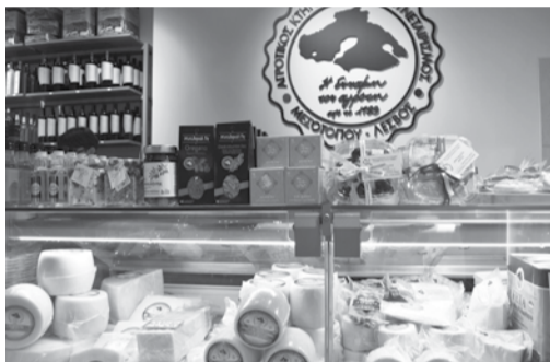
Το κατάστημα του Συνεταιρισμού μας στη Θεσσαλονίκη.

Από τον περασμένο Ιανουάριο άνοιξε κατάστημά του στη Θεσσαλονίκη, στην αγορά Μοδιάνο. Το μαγαζί διαθέτει όλα τα τυροκομικά-γαλακτομικά προϊόντα του Αγροτικού Συνεταιρισμού μας: φέτα ΠΟΠ, κατσικίσιο τυρί, λαδοτύρι, ξερή μυτζήθρα, γραβιέρα, πρόβειο συμβατικό, στραγγιστό και βιολογικό γιαούρτι, κρέμες σε διάφορες γεύσεις (μπανάνα, φράουλα, σοκολάτα, βανίλια). Επίσης φιλοξενεί και διαθέτει και άλλα λησβιακά προϊόντα ιδιωτών παραγωγών, όπως ελιές, λάδι, παξιμάδια, ούζο και μέλι! Η πορεία του καταστήματος είναι πολύ καλή. Η συμπερωτεύουσα έχει σημαντική λησβιακή παροικία, που αναζητά επίμονα προϊόντα από το νησί αλλά και μερακλήδες ανθρώπους που ψάχνουν το αυθεντικό προϊόν, πόσο μάλλον όταν αυτό είναι και ποιοτικό και σε καλή τιμή.