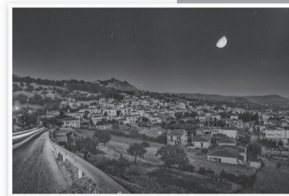
Στην αρχή των ασπιδών - από το Σαυρί

Περιδιαβαίνοντας φτάνουμε σιγά σιγά στη δική μας γειτονιά, εκεί που μικρά παιξαμε, τρέξαμε, χτυπήσαμε, κλάψαμε και γελάσαμε. Με την καρδιά μας. Και με την ίδια αυτή καρδιά να χτυπά δυνατά ήμε «Γύρισα» .