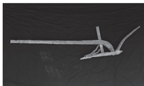
Το αλέτρι ήταν καμωμένο από ξύλο βαλανιδιάς & πλάτανου & ο ζυγός στο σβέρκο των αγελάδων από ξύλο λεύκας για να είναι ελαφρύς

Ας παρακάμψουμε την περίπτωση που δεν βοτανίσουμε το σιτάρι κι έχει κάθε λογής αγκάθια, πραγματικό μαρτύριο για τα χέρια κατά τον θερισμό και το δέσιμο σε δεμάτια. Για το δέσιμο χρησιμοποιούσαμε βέργες από λυγαριά ή από το ίδιο φυτό του σιταριού, όταν είχε αρκετό ύψος. Απαραίτητο να δεθεί σε δεμάτια για την μεταφορά, έστω κι αν έπρεπε ν' αλωνιστεί μέσα στο ίδιο το χωράφι.