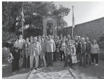
Εκδρομή στα Γιάννενα

Η πρώτη στάση φυσικά έγινε στο Μπιζάνι και στο μουσείο κέρινων ομοιωμάτων του Παύλου Βρέλη.